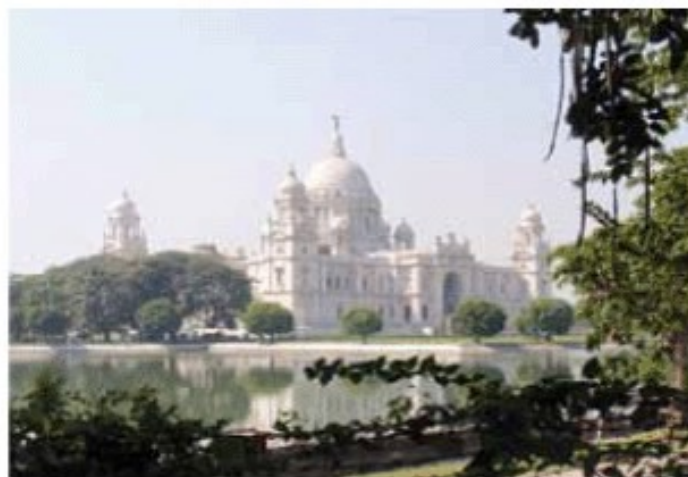
Victoria Memorial i Kolkata

Besöken på olika sevärda platser blev många under vår resa. Som exempel kan nämnas Victoria memorial, klostret där moder Teresa jobbade och flera buddisttempel.