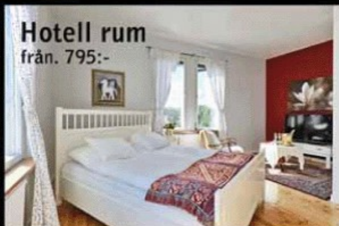
Hotell rum från. 795,-