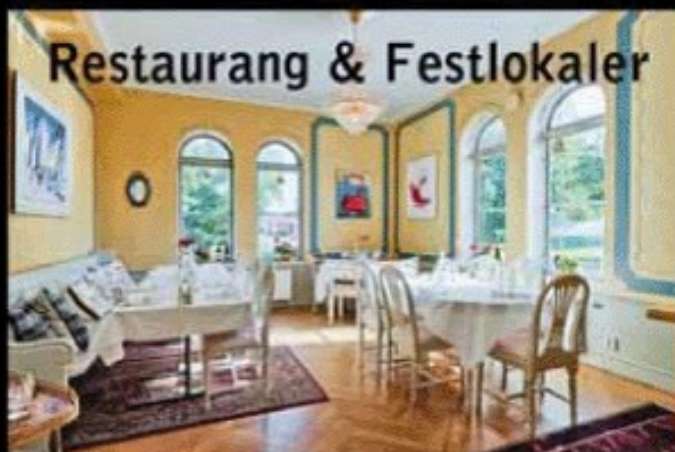
Restaurang & Festlokaler