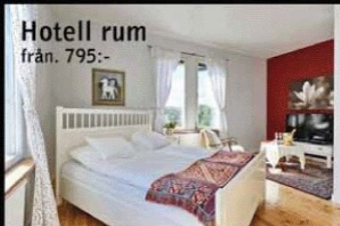
Hotell rum från. 795:-

Bruksgatan 6 ■ SKULTUNA ■ 021-70 160 www.skultunabrukshotell.se