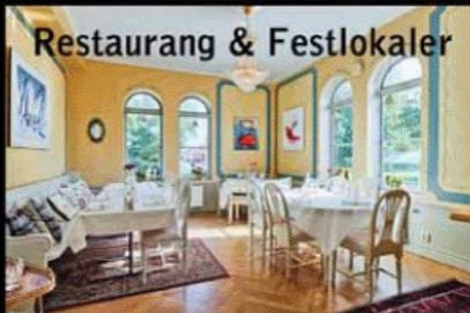
Restaurang & Festlokaler

Gratis buss från Brukshotellet till Västerås varje julbordskväll kl. 23:30