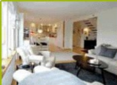
Vardagsrummet mot hallen