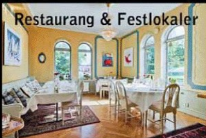
Restaurang & Festlokaler