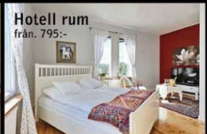
Hotell rum från. 795:-

Bruksgatan 6 ■ SKULTUNA ■ 021-70 160 www.skultunabrukshotell.se