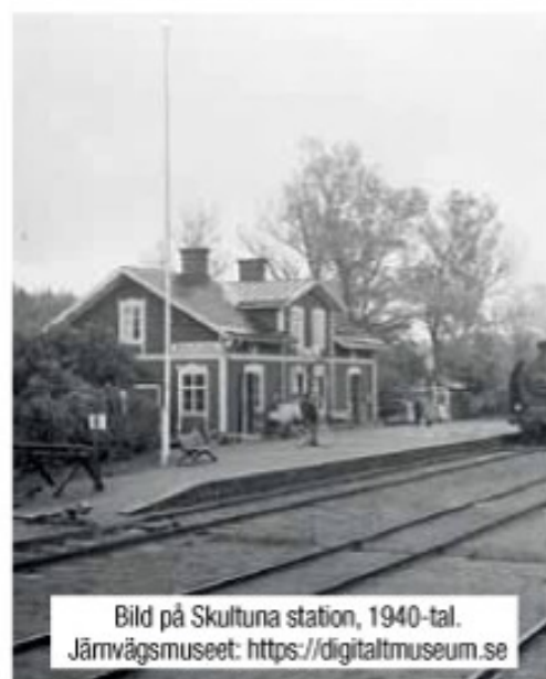
Bild på Skultuna station, 1940-tal.

Det här var en liten del av all den poesi och konst som prydde väggarna i det stiliga dasset, men raderna fastnade direkt och har legat kvar i hårddisken sedan dess.