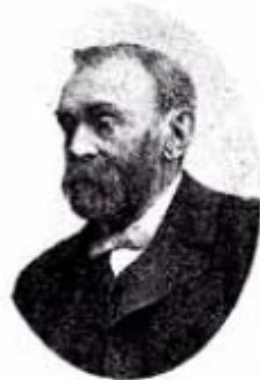
Doktor ALFRED NOBEL