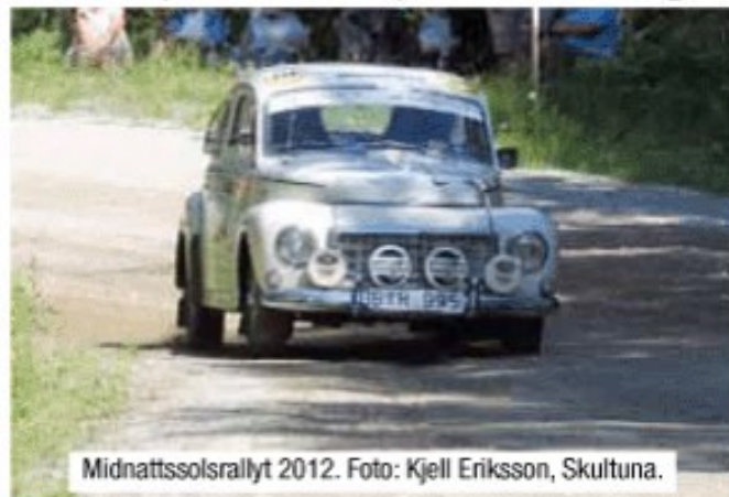
Midnattssolsrallyt 2012.

Antalet brott har minskat kraftigt under alla år som vi har varit verksamma i Skultuna, vi är den del av Västerås som har lägst andel brott per innevånare. Något som VLT inte har visat. Tyvärr har det blivit en hel del svarta rubriker om Skultuna, men det har också gjorts några reportage som har visat Skultunas positiva sidor. Tyvärr så får det negativa alltför stor framtoning.