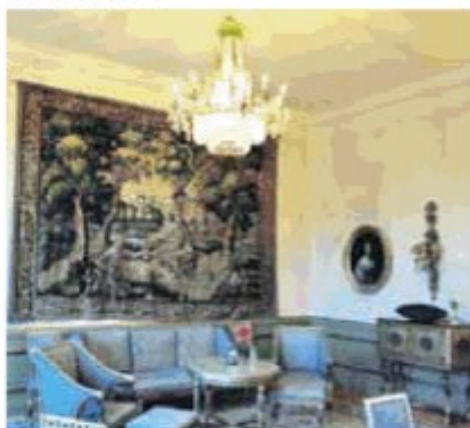
Ett av de vackra rummen i slottet med anrika möbler och konst.

Genom reduktion återgick slottet till kronan. Gustaf III var nog den mest berömda ägaren av slottet. Historierna är många om honom och slottet. Det var under många år hans favoritslott och han ägnade mycket tid åt parkanläggningarna och dammarna. Men 1785 sålde Gustaf III slottet till en grosshandlare och skeppsredare, George Seton.