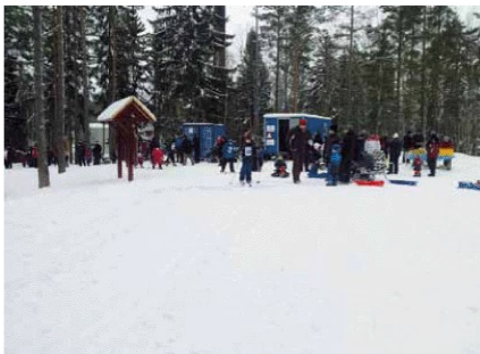
Det blev en lyckad dag i skidspåret med 78 startande när Skultuna IS Skidor arrangerade Barnens Vasalopp den 17/2.