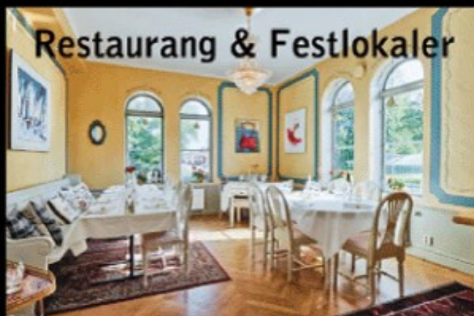
Restaurang & Festlokaler