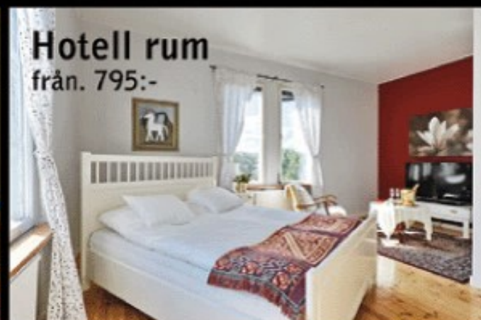
Hotell rum från. 795,-

Bruksgatan 6 ■ SKULTUNA ■ 021-70 160 www.skultunabrukshotell.se