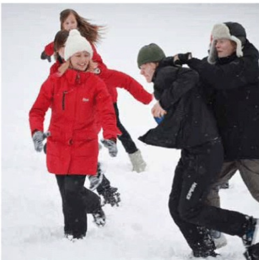
"Hårda tag i Snöruggby!"

Efter en sömlös natt för mig var det dags att gå upp vid åtta och sedan äta frukost klockan nio. Efter att vi hade ätit så var vi för det mesta i Masmästaren och gjorde olika övningar, lekar och en massa andra saker. Senare på kvällen var det dags för kulkväll och sen Melodifestivalen! Efter det var det dags för godnattsaga och sen så var det läggdags för jag var helt slut efter en dag full med aktiviteter.