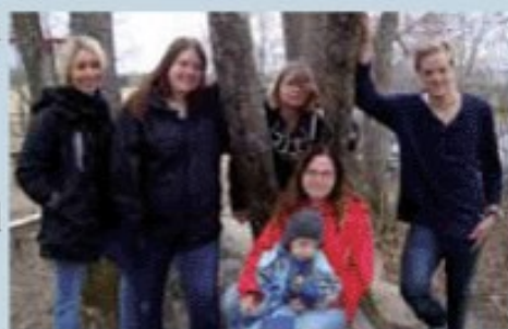
Vi arbetar alla på Olympicaskolan i Haraker!