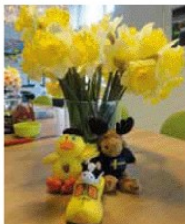
Våra maskotar - ankan Jules från Frankrike, kossan Clara från Nederländerna och älgen Amos från Sverige.

Nästa arbete handlar om att tillverka spel åt varandra samt att filma utomhuslekar. Sen ska vi förstås spela varandras spel och leka varandras lekar. Till hösten startar vi ett arbete där vi skapar i ord och bild med hjälp av musiken i Vivaldis "De fyra årstiderna".