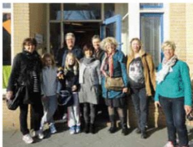
Den svenska och den franska gruppen utanför en av skolorna.

Vi var också med på lektioner och vi hade projektmöten.